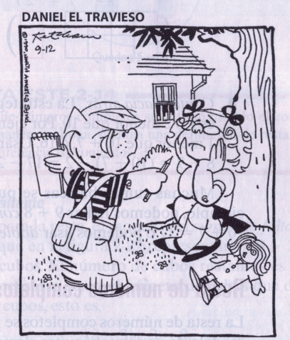
"DECÍDETE. PRIMERO ME DICES QUE 3 MÁS 3 ES SEIS, Y AHORA DICES QUE 4 MÁS 2 ES SEIS!"